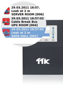
多个警报可在同一个屏幕上显示