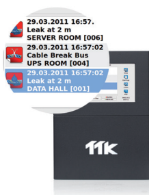
Fuites simultanées peuvent être détectées et affichées