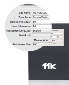
Interface utilisateur conviviale facilitant la configuration