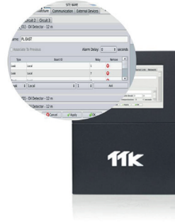
简易设置每根线缆的干接点