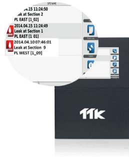
多个警报可在同一个屏幕上显示