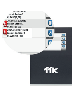
Darstellung zeitgleicher Alarme