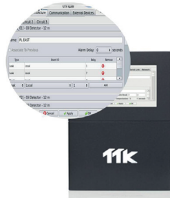
Einfache Einrichtung von Schnittstellen